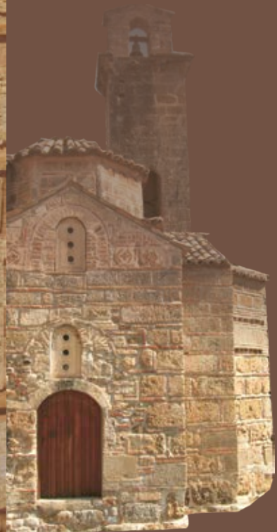
ΥΠΟΥΡΓΕΙΟ ΠΟΛΙΤΙΣΜΟΥ 26Η ΕΦΟΡΕΙΑ ΒΥΖΑΝΤΙΝΩΝ ΑΡΧΑΙΟΤΗΤΩΝ